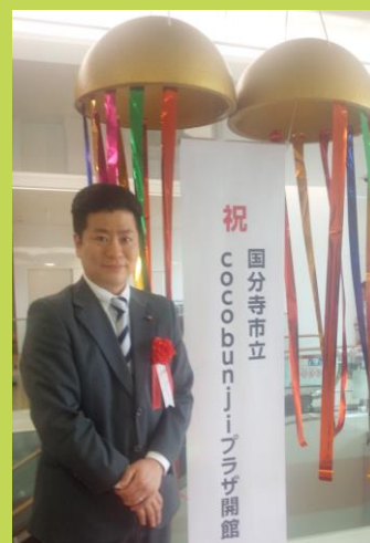
↑ 国分寺駅に新ホールなどが開館!

国分寺駅のツインタワー(583戸)と日立中央研究所に隣接する大型マンション(494戸)の入居が始まり、人口も2000人くらい増加するとのこと。このご時世に人口が大きく増えるのはありがたいことで、市税も5億近い増収が予想され、周辺への経済効果も見込まれます。 後者のマンションはファミリータイプの物件が多いとのこと、現在問題となっている 小学校の教室不足 や 保育園の入所 に影響があるかもしれません。今後の転入者の状況をしっかりとチェックし、対応を適切に判断していく事を強く求めているところです。