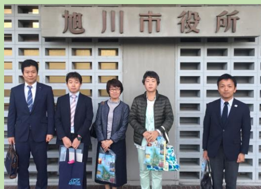
↑ 10月に会派で北海道視察を行いました