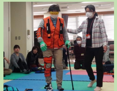
↑ 防災まちづくり学校での高齢者体験

ご意見・ご要望などは下記まで ~市内どこでも駆けつけます！~ 185-0035 国分寺市西町 4-1 けやき台団地 38-303 TEL:070-2833-5666 FAX:042-534-9123 ホームページ:www.datejun16.net メール:info@datejun16.net