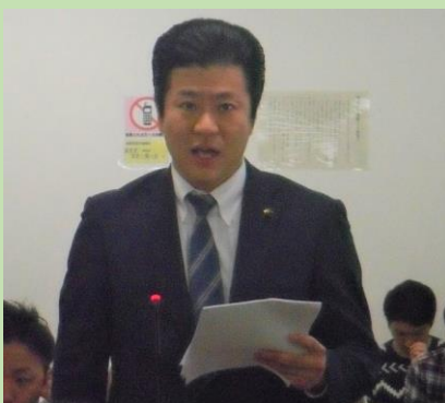
↑ 本会議での一般質問の様子

まだ素案の段階であり、これからしっかりと議論を重ね、より良い選択肢を見つけていきたいと思えます。