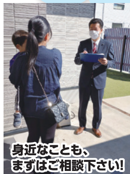
身近なことも、 まずはご相談下さい!

この自治体経営の循環をより高回転にするエンジンとなって、国分寺市政を動かします!!