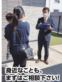
身近なことも、 まずはご相談下さい!